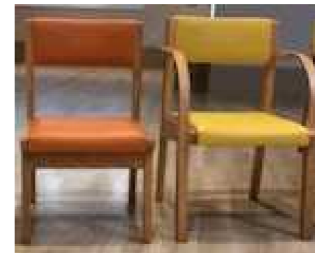
からだに合わせて違う高さの椅子を準備しました