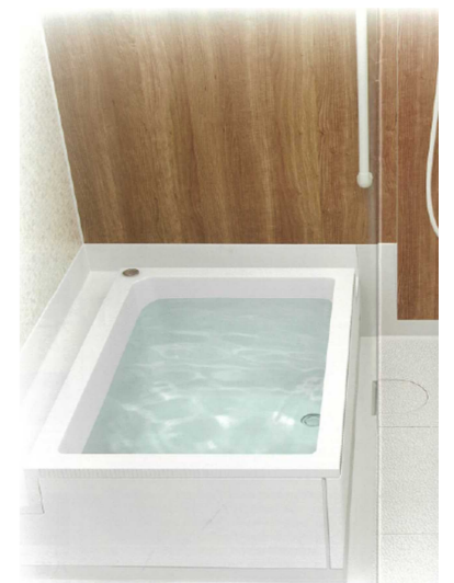
周囲全てが手すりになりになる浴槽