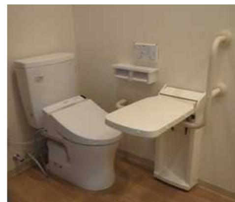
トイレには立ち上がり補助テーブルを設置